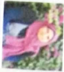
أسماء حussen لغة عربية