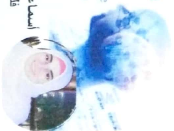
أسماء حussen فلسفة

19th International Conference Artificial Intelligence in Education