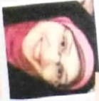
نور هان جمال تاريخ